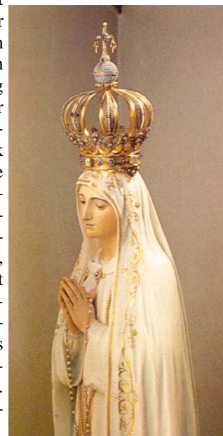
Muttergottesstatue in der Erscheinungskapelle von Fatima. In die Krone wurde die Kugel des Attentats von Rom am 13. Mai 1981 eingebaut.

Die Gottesmutter habe dieses Zeichen den "Kleinen" anvertraut, wie auch schon im Evangelium davon die Rede sei, dass