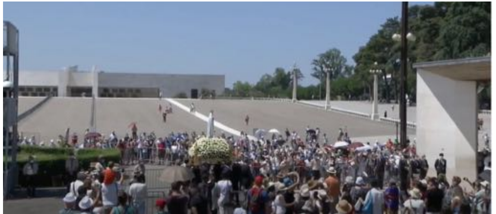
Rückkehr der Statue in die Erscheinungskapelle am 13. Juli 2020

Nach den Worten „mehrere Nationen werden vernichtet werden“ hat Maria den dritten Teil des Geheimnisses verkündet.