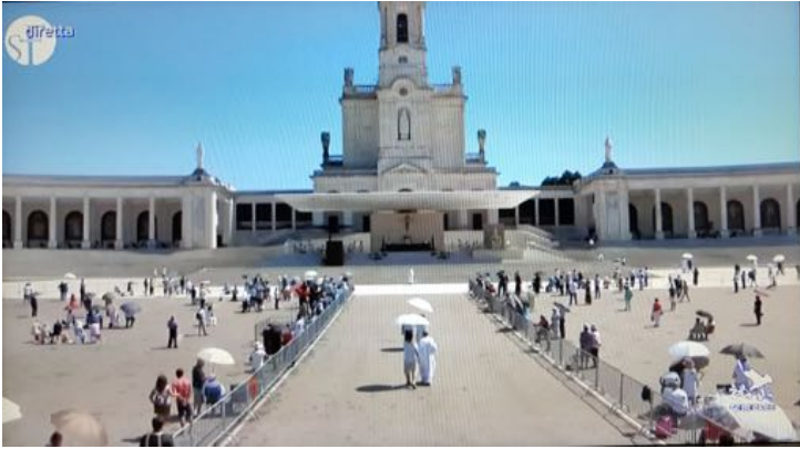
Trostloses Bild des praktischen leeren Platzes am 13. Juli 2020

Der Bischof sagte zum Schluss: „Hier in diesem Heiligtum möchte unsere Mutter Maria uns helfen, Jünger Jesu zu sein. Auf Ihn zu hören,