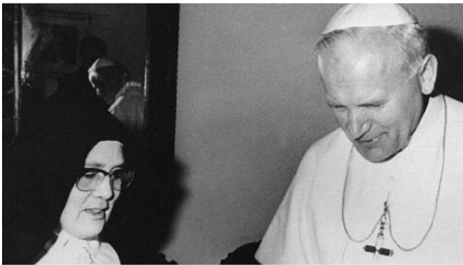
1982 trifft Schwester Lucia Papst Johannes Paul II. Die Aufforderung Mariens zur Weihe Russlands ist ihr ein großes Anliegen.

Der hier abgedruckte Artikel erschien erstmals unter dem Titel „Das Ringen um die Weihe Russlands. Ein Blick auf die Ereignisse des vergangenen Jahrhunderts hilft, die Bedeutung Russlands in der Botschaft von Fatima zu verstehen“: ‚Die Tagespost‘, 7. September 2017, Seite 6. Eine ausführlichere Darlegung des angesprochenen Themas bietet der Verfasser an anderer Stelle: Manfred Hauke, „Der heilige Johannes Paul II. und Fatima“: Ders. (Hrsg.), Fatima – 100 Jahre danach. Geschichte, Botschaft, Relevanz (Mariologische Studien 25), Regensburg 2017, 246-303, hier 277-288 („Die Weihe Russlands“) (Manfred Hauke).