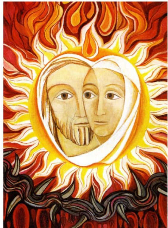
Meditation zum Gemälde