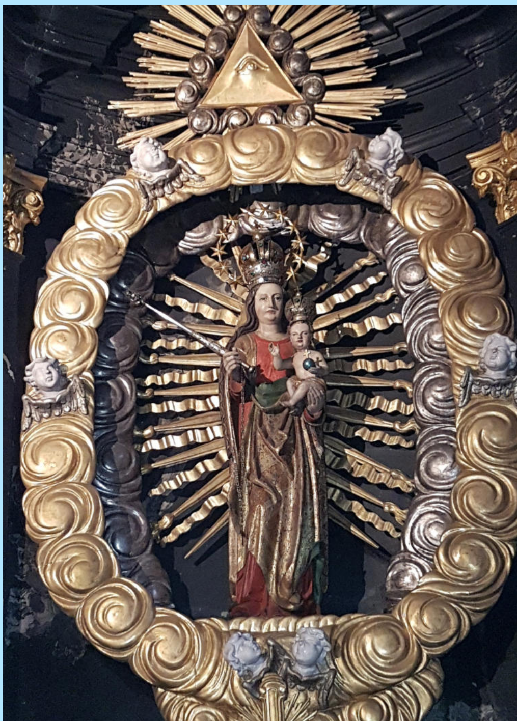
Wallfahrtskapelle Jonental, Jonen AG

“Am Ende wird mein Unbeflecktes Herz triumphieren!“