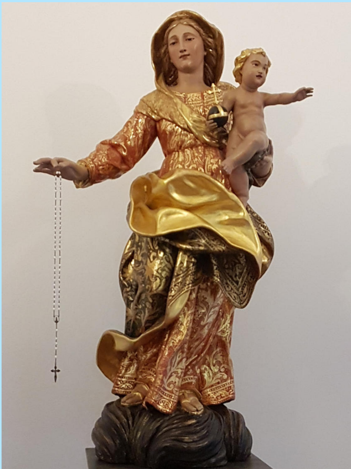
Ehemaliges Augustinerinnenkloster, Monte Carasso (TI)

“Am Ende wird mein Unbeflecktes Herz triumphieren!”