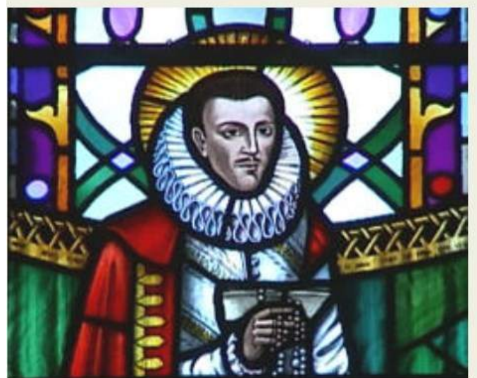
Philipp Howard von Arundel

Am Anfang der Zeit der Kirche sprach der Heilige Geist diese Worte durch den heiligen Apostel Johannes zu den Jüngern Christi aller Zeiten und zu uns heute: „Sei getreu bis in den Tod und ich werde dir die Krone des Lebens geben“ (Apk 2, 10). Amen.